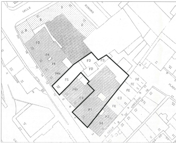
PLANEAMIENTO VIGENTE E:1/500